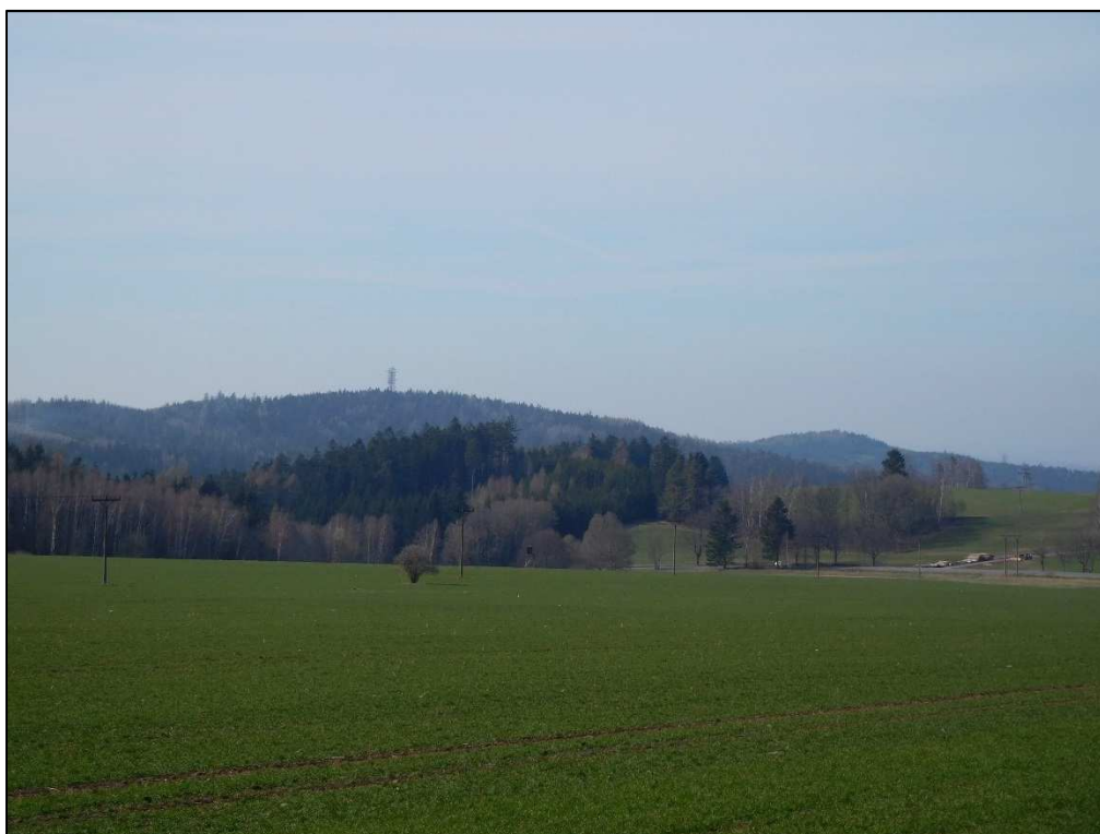
Lesní komplex od obce Borová